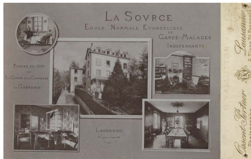
Présentation de La Source, Ecole normale évangélique de garde-malades indépendantes Ossent-Portner ; Lausanne, photographe Tirage au gélatinobromure d'argent, montage ; Collections iconographiques, Archives Fondation La Source, ID 10000824.