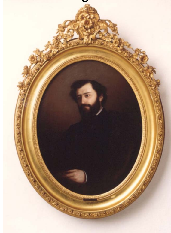
Portrait du Comte Agénor de Gasparin, pastel, 1851.

Louisa Couronne - Forbes-Durand Collections, Archives Fondation La Source, ID 100006517