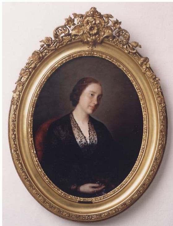
Portrait de la Comtesse Valérie de Gasparin, née Boissier, pastel, 1851.

Louisa Couronne - Forbes-Durand Collections, Archives Fondation La Source, ID 100006517