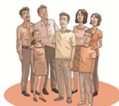
Dessin de Sébastien Perroud

Les proches aidants jouent un rôle essentiel dans le processus de rétablissement des patients atteints de troubles psychiatriques. Toutefois, ce rôle présente parfois des risques pour la santé des proches, tels qu'une baisse de la qualité de vie et une détresse importante. À ce jour, les soutiens offerts aux proches ne répondent pas à l'ensemble de leurs