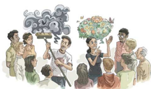
Dessin de Sébastien Perroud

La schizophrénie est une maladie psychiatrique sévère qui se caractérise par des symptômes psychotiques comme les hallucinations verbales et les idées délirantes et des symptômes déficitaires comme la réduction du