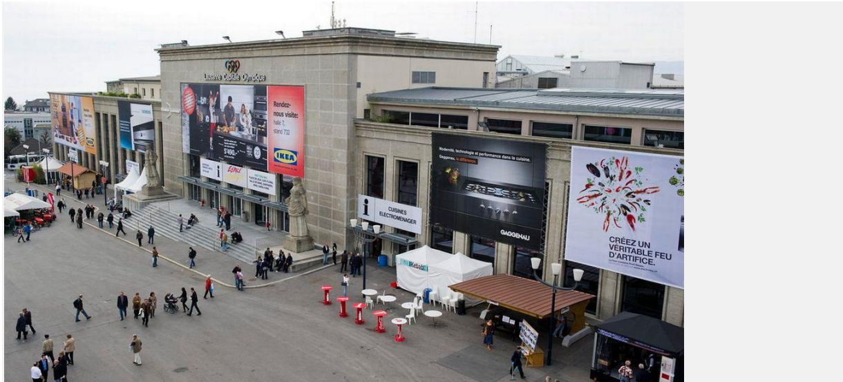
Le Palais de Beaulieu à Lausanne, au coeur d'un quartier appelé à se redynamiser.

Le quartier lausannois de Beaulieu, se remet du rejet en votation de la tour Taoua en 2014 et envisage d'accueillir de nouveaux acteurs comme une école d'infirmières, le Béjart Ballet et le Tribunal arbitral du sport (TAS).